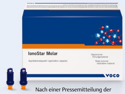
Nach einer Pressemitteilung der VOCO GmbH, Cuxhaven Internet: www.voco.de

sche wie haltbare Restaurationen schnell und einfach herstellen. IonoStar Molar eignet sich für Füllungen von nicht okklusionstragenden Kavitäten der Klasse I, semipermanente Füllungen von Kavitäten der Klasse I und II, Füllungen von Zahnhalsläsionen, Klasse-V-Kavitäten, Behandlung von Wurzelkaries, Füllungen von Klasse-III-Kavitäten, Restauration von Milchzähnen, als Unterfüllung bzw. Liner, für den Stumpfaufbau sowie für temporäre Füllungen.