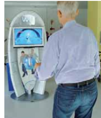
Abb. 6 Wii Play Motion

Wii Play Motion > Um Reich- und Greiffunktionen auf hohem Niveau kombiniert zu trainieren, steht den Patienten ein weiteres Programm zur Verfügung: die Wii Play Motion. Man benötigt die Wii Spielekonsole und einen Adapter für die zwölf Spiele. Diese erfordern eine angemessene Bewegungsgeschwindigkeit und -koordination sowie exakte Handgelenksbewegungen. Nur wenn der Patient die Bewegungen sauber ausführt, registriert sie ein Sensor und überträgt sie auf den Bildschirm.