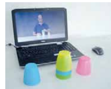
Abb. 2 Physiofun Senso Move

1995 bewies der Neurophysiologe Rizzolatti, dass nur das Betrachten einer motorischen Bewegung bestimmte Areale im Hirn aktiviert und eigene Funktionen anbahnt [5]. Dieses Prinzip nutzt auch das Softwareprogramm Physiofun Senso Move: Der Patient betrachtet Videosequenzen von Alltagshandlungen, zum Beispiel den Becher zum Mund führen, den Tisch abwischen etc. Zuerst soll er die Sequenz aufmerksam beobachten. So werden im prämotorischen Kortex die Spiegelneuronen aktiv, die den motorischen Kortex aktivieren – als würde man die Bewegung selbst ausführen. Anschließend soll sich der Patient die Bewegung so vorstellen, als würde er sich selbst bei der Ausführung beobachten beziehungsweise während der Ausführung in seinem Körper stecken. Dieses Prinzip des mentalen Trainings findet man auch im Leistungssport, wenn es darum geht, einen Bewegungsablauf zu erlernen oder zu verbessern. Zum Schluss führt der Patient die Sequenz in seinen motorischen Möglichkeiten aktiv durch, was wiederum den (prä-)motorischen Kortex aktiviert [6].