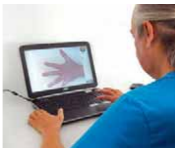
Abb. 1 Physiofun Links-Rechts-Training

Ansprechend, kostengünstig und fundiert > Es gibt Firmen, die ein komplettes Set an Geräten für ein computergestütztes Training anbieten wie das „rehaworks Armlabor“ von rehaworks Therapie-systeme. Oft sind solche Komplettsysteme jedoch kostenintensiv. Das Team des Dr. Becker PhysioGym entschied, auf vorhandene Softwareprogramme seiner Einrichtung zurückzugreifen und diese bestmöglich mit weiteren Geräten zu kombinieren. Die Herausforderung bestand darin, ein ansprechendes Angebot zu schaffen – begründet auf den aktuellen neurowissenschaftlichen Erkenntnissen. Bei neuen Produkten achteten die Therapeuten auf erschwingliche Anschaffungskosten, um es den Patienten zu ermöglichen, die Therapie nach dem Aufenthalt fortzuführen. Sie wählten sechs Geräte für unterschiedliche Bedarfe aus (☞ Tab. 1).