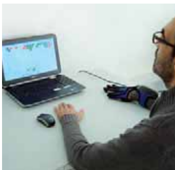
Abb. 5 HandTutor

– selektive Handgelenksbewegungen in Kombination mit proximaler Aktivität mit vielen Wiederholungen.