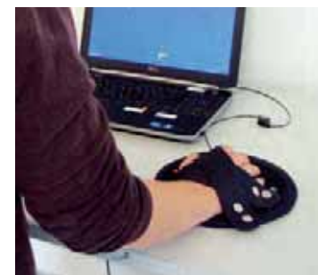
Abb. 3 Mobilas

Mobilas > Das Lagerungs- und Mobilisationssystem Mobilas dient der funktionellen Handlagerung. Es bietet aber auch mehrere Möglichkeiten zum Eigentaining, zum Beispiel Reichbewegungen auf Tischebene. Die Patienten können die Bewegungen anfangs beidhändig, später einhändig