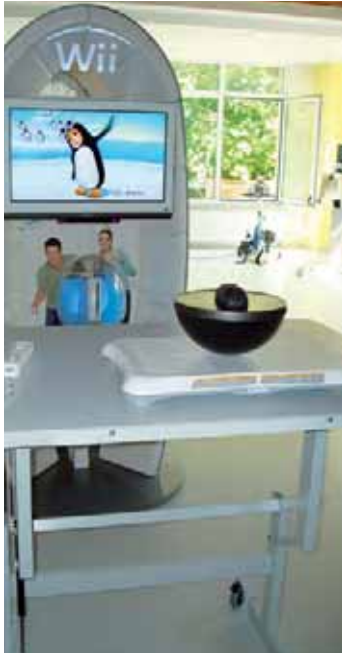
Abb. 4 Basic Ball Therapie-Halbkugel

durchführen. Es ist gut mit einem computergestützten Training kombinierbar: An der Unterseite von Mobilas befindet sich eine Aussparung, in die eine Kindermaus passt. Somit kann man alle Computerprogramme und -spiele bedienen, die keinen Mausclick erfordern, etwa die Visuomotorik-Spiele von Cogpack.