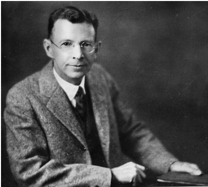
Coolidge Portrait.

Der Name Coolidge ist untrennbar mit einer bedeutenden technischen Entwicklung der Röntgenröhre verbunden. Seine Entwicklung der Glühkathoden-Hochvakuum-Röntgenröhre hat die Radiologie in