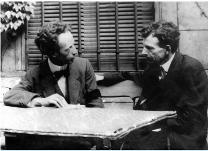
Dessauer und Coolidge (Quelle: Archiv Deutsches Röntgenmuseum).

ber 1913. Cole taufte diese noch im selben Monat „Coolidge-Röhre“.