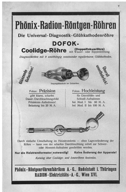
Phönix-Radion-Röntgenröhren Coolidge-Prospekt

Den entscheidenden technischen Fortschritt, den die Coolidge-Röhre auslöste, beschrieb der Aschaffener Physiker und Röntgenpionier Friedrich Dessauer (1881-1963) wie folgt: „Die allergrößte Schwierigkeit bei der Konstruktion und beim Betrieb der ‚gashaltigen‘ Röhren bestand in dem Umstand, dass Strom- und Spannungsverlauf der Gasentladung hierbei nicht getrennt zu regeln sind. Erhöhung der Spannung bedeutet zugleich Vermehrung der Stromstärke und Änderung des Stromverlaufs. Die älteren Radiologen waren zum Teil recht gute Techniker und sie mussten es sein, um das Verhalten ihrer Röhren bei jedem Regulieren der