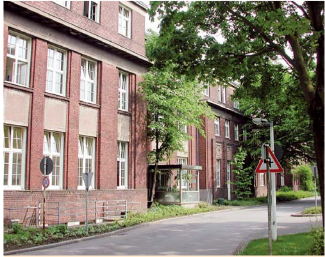
Abb. 8 Das Gebaude der Hautklinik Krefeld – Ubersicht.

lid Assaf mit der Klinik und den Abläufen vertraut, stellte ihn sowohl den cheförztlichen Kollegen des Hauses sowie den niedergelassenen dermatologischen Kollegen der Region persnlich vor. Basierend auf diesem Fundament und der freundlichen Einfuhrung, konnte in den nachfolgenden Jahren dieses „Erbe“ erweitert werden. Es folgte mit Amtsantritt erstmals die Einfuhrung der Dermatohistologie in die Krefelder Hautklinik. Dies ist ein fur dermatologische Kliniken eher seltener Ablauf – besteht doch meist eher die Befurchtung, die Dermatohistologie an fremde Abteilungen zu verlieren. Fur die Dermatologische Klinik Krefeld definitiv ein glucklicher Umstand, da dadurch, ahnlich wie bei anderen groen Hautkliniken mit eigener Dermatohistologie, die diagnostische Qualitat erheblich gesteigert werden konnte.