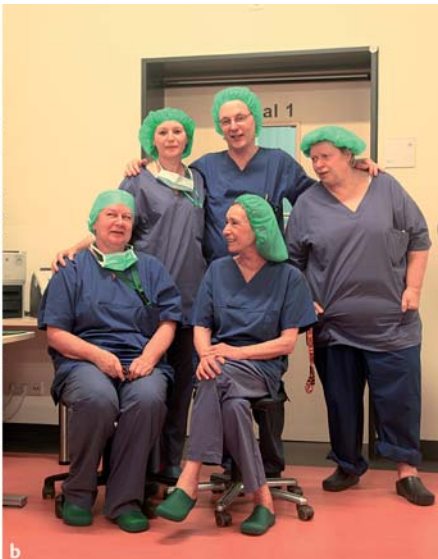
Abb. 7 Hautklinik Krefeld. a Eingriffsraum 1. b Das OP-Team.