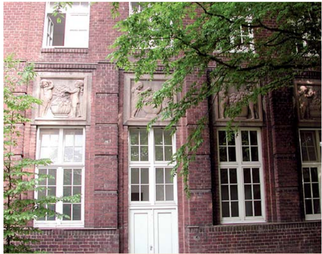
Abb. 9 Das Gebaude der Hautklinik Krefeld. Historische Details.