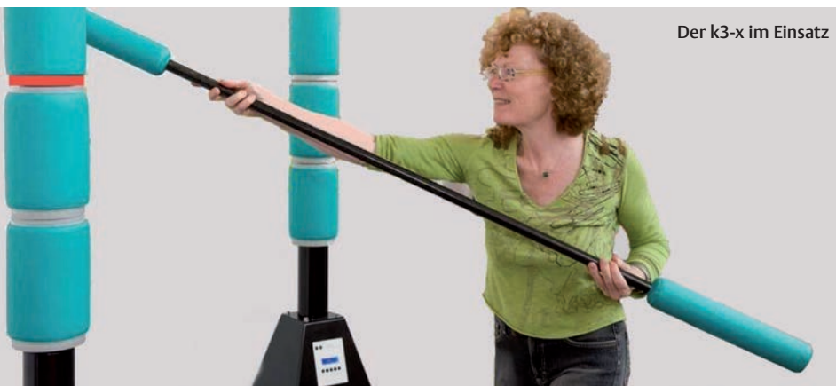
Der k3-x im Einsatz

Der Test des k3-x erfolgte in einer mittelgroßen physiotherapeutischen Praxis mit den dort typischen Patienten. Aufgrund dessen wurden die Einsatzmöglichkeiten des Geräts anders geprüft als beispielsweise in einem Fitnessstudio. Als Fachmagazin für Physiotherapie wollten wir herausfinden, ob sich das Gerät für den Einsatz in einer Physiotherapiepraxis eignet. In der Einführung wurde nach Aussagen der Testerin erläutert, das Ziel des Trainings sei es, in der vorgegebenen Zeit möglichst viele Treffer ohne Fehler zu erzielen (natürlich in einer flüssigen Bewegung). Deshalb habe sie nicht die Trainierenden zum Tempowechseln aufgefordert. An Einfallsreichtum habe es ihr sicher nicht gemangelt.