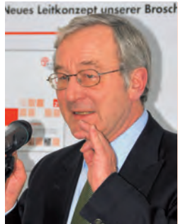
Abb. 1 Dr. Wolfgang Schoepffer, niedersächsisches Sozialministerium.

tenrechtskonvention. Denn: Inhaltlich stehe man in der Eingliederungshilfe vor einem Paradigmenwechsel, weg von der Einrichtung und hin zur Personenzentrierung. Um diese qualitativen Veränderungen zu erreichen, brauche es gesetzliche Veränderungen noch in dieser Legislaturperiode, auch wenn finanzielle Auswirkungen auf den Bund und die Länder bisher noch ausgeklammert werden mussten.