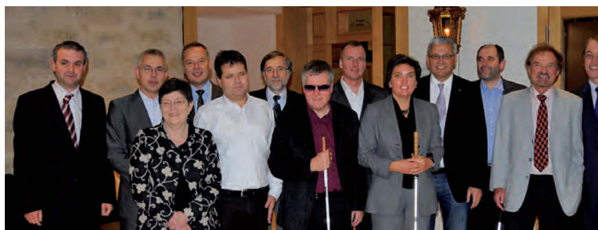
Abb. 5 Teilnehmer der zweitägigen Fachtagung am 2./3.11.2011 in Nürnberg.