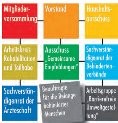
Abb. 4 Die Gremien der Bar.

16 Bundesländer – 16 Beauftragte und ein Bundesbeauftragter, da sind stringente Abstimmungsprozesse unumgänglich. Nur in konzertierter Phalanx lässt sich politische Willensbildung umsetzen. Daher finden seit 1990 regelmäßig zweimal im Jahr Gespräche zwischen den Landesbeauftragten und der BAR statt. Seit 1995 nimmt auch der Beauftragte der Bundesregierung für die