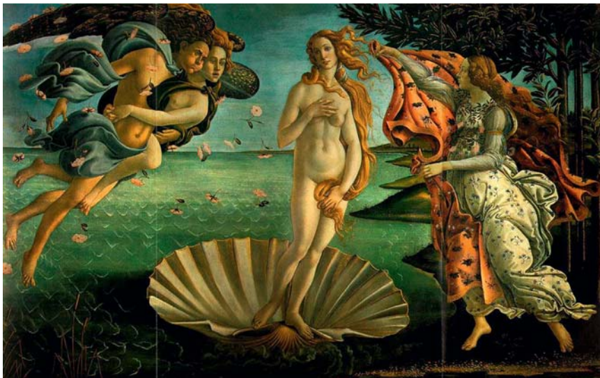
Abb. 6 Die Geburt der Venus von Sandro Botticelli, 1485/86, Uffizien Florenz (Quelle: Wikipedia Commons).

typische Gestalt einer Schwindsüchtigen, und durch die Gemälde Botticellis, v.a. die Venus, aber auch der Frühling, wurde diese zerbrechliche, melancholische Schönheit zum weiblichen Schönheitsideal der Renaissance. Viele Künstler eiferten Botticelli nach, und an schwindsüchtigen Modellen dürfte weder in Florenz noch andernorts zu dieser Zeit großer Mangel geherrscht haben.