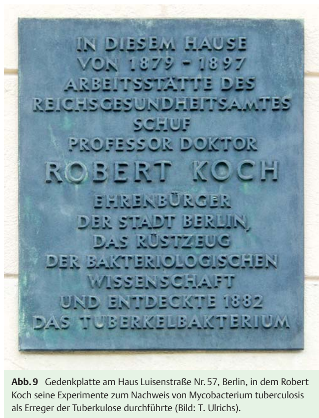
Abb. 9 Gedenkplatte am Haus Luisenstraße Nr. 57, Berlin, in dem Robert Koch seine Experimente zum Nachweis von Mycobacterium tuberculosis als Erreger der Tuberkulose durchführte.

oder Verwendungen der Tuberkulose in Dichtkunst, bildender Kunst oder Musik. Bekanntlich scheiterte Robert Koch mit dem Versuch, einen Impfstoff gegen Tuberkulose zu entwickeln. Sein Tuberkulin wird heute allerdings immer noch als Hauttest eingesetzt zum Nachweis eines stattgehabten Kontaktes mit Mykobakterien. Und erst noch einmal sehr viel später wurde mit dem Streptomycin durch Salman Abraham Waksman das erste gegen M. tuberculosis wirksame Antibiotikum gefunden [19]. Später folgten weitere nach, die als Kombinationstherapie noch heute angewendet werden. Robert Koch erhielt für seine bahnbrechenden Arbeiten zur Tuberkulose den Medizinnobelpreis im Jahre 1905.