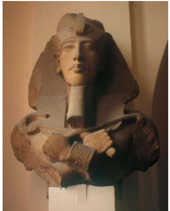
Abb. 3 Kolossalbüste Echnatons im Ägyptischen Museum in Kairo. Die Büste wurde für eine Untersicht hergestellt, deshalb ist sie auch im Museum erhöht angebracht (Bild T. Ulrichs).

Auch unter den Sklaven Roms war die Tuberkulose sehr verbreitet. Arbeitsausfälle oder gar Tod eines Sklaven bedeuteten für seinen Besitzer einen großen wirtschaftlichen Verlust, sodass bald nach Heilungsmöglichkeiten gesucht wurde. Es wurde festgestellt, dass viel frische Luft, ein Klimawechsel („mutatio coeli“), einer Genesung förderlich ist. Deshalb wurden Sanatorien für Sklaven (valetudinaria) an Orten mit besonders guter Luft eingerichtet, z. B. an der Küste des Golfes von Neapel (• Abb. 4 ). Nicht nur Sklaven profitierten von der Einsicht der mutatio coeli. Auch