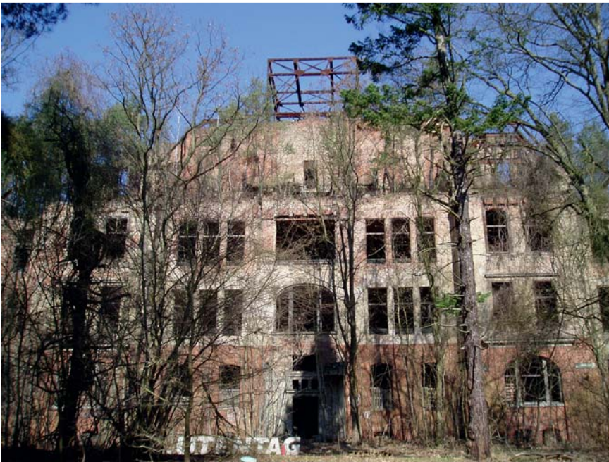
Abb. 8 Die ehemalige Tuberkulose-Heilanstalt Beelitz-Heilstätten südwestlich von Berlin vor 100 Jahren.

Todes“. Jeden konnte es treffen, unabhängig von Stand und Beruf (wobei natürlich die ärmeren Bevölkerungsschichten häufiger betroffen waren).