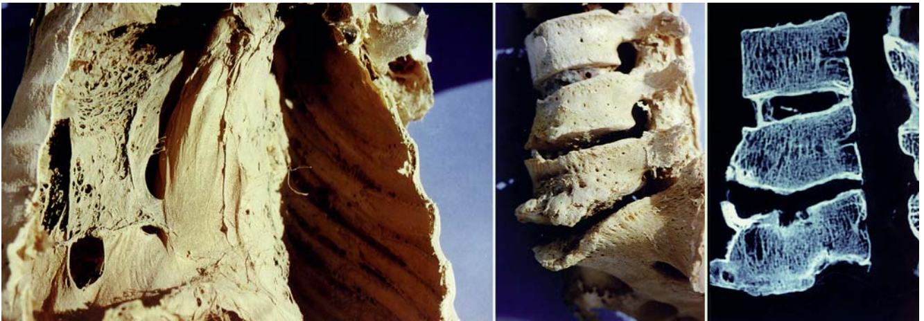
Abb. 2 Befunde aus Mumien, Neues Reich. Die klinischen Befunde stammen von altägyptischen Mumien des Neuen Reiches; im linken Bild ein aufgeschnittener Thorax mit teilweise erhaltenem, mit der Pleura verklebtem Lungengewebe infolge einer tuberkulösen Pleuritis exsudativa; im rechten Bild die im Sinne einer abszedierenden Knochentuberkulose veränderte Lendenwirbelsäule einer Mumie samt dazugehörigem Röntgenbild. vgl. Zink und Nerlich, 2004 [6].

kachektischen, akromegalen Herrscher, von dem überliefert ist, dass er häufig krank gewesen sei (• Abb. 3 , [8,9]). Ca. 1334 v. Chr. ist er wahrscheinlich an Tuberkulose gestorben, seine Töchter wenig später auch. Sein Sohn (nach neuesten DNA-Untersuchungen als sicher angenommen) und Nachfolger Tutanchaton (1332 – 1323 v. Chr.) führte bald darauf die Verehrung sämtlicher ägyptischen Gottheiten wieder ein, auch die des Staatsgottes Amun (weshalb er sich später auch konsequenterweise Tutanchamun, „Lebendes Abbild des Amun“, nannte). Die Annahme, dass auch Tutanchamun im Alter von ca. 18 bis 20 Jahren Opfer der Tuberkulose wurde, konnte jüngst widerlegt werden [10,11]. Man nimmt heute einen Jagdunfall an und diskutiert auch einen Tod infolge einer Sichelzellanämie. Mit dem Tode Echnatons endete der erste Monotheismus der Menschheit. Erst Jahrhunderte später breitete sich unter dem Nachbarvolk der Hebräer die Verehrung eines einzigen Gottes aus.