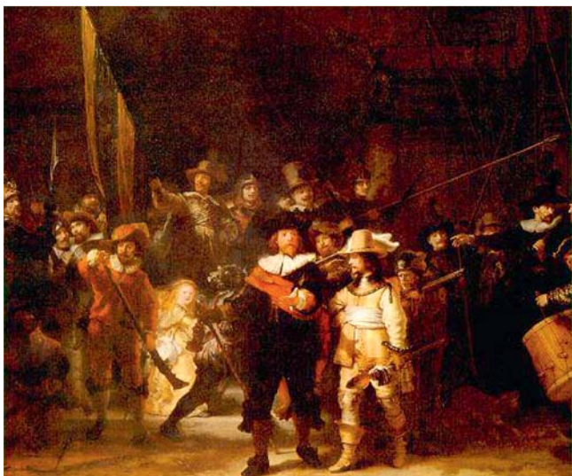
Abb. 7 Rembrandts „Nachtwache“, Rijks-Museum Amsterdam (Quelle: Wikipedia Commons).

tung. 1650 beschrieb der holländische Neuroanatom Franciscus Sylvius (1614–1672) zum ersten Mal ein morphologisch-pathologisches Korrelat der Erkrankung, den Tuberkel (Höcker, knotige Schwellung). Er schätzte ihn ein als Sitz der Erkrankung und legte damit die Grundlage einer morphologischen Beschreibung der Tuberkulose. Tatsächlich sollte seine Umschreibung der knotig erscheinenden granulomatösen Veränderungen (Tuberkel) der Tuberkulose den Namen geben. 1689 wurde von Richard Morton (1637–1698) in London der Tuberkel mit der Phthisis (Schwindsucht) in Zusammenhang gebracht 3 . Insgesamt wurden 14 verschiedene Formen der Phthisis beschrieben. Jedoch erst Johann Lukas Schönlein (1793–1864) erkannte schließlich die Tuberkulose als eigenständiges Krankheitsbild und gab ihr ihren Namen [16].