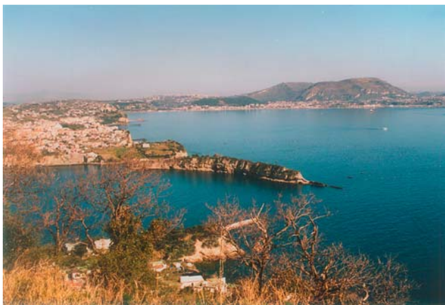
Abb. 4 Ansicht des Golfes von Neapel. Reiche Römer hatten hier ihre Villen und verbrachten hier oft die Sommermonate wegen des günstigen Klimas und um dem ungünstigen der Stadt Rom zu entfliehen. Auch valetudinaria wurden hier eingerichtet.

andere Tuberkulosepatienten, v. a. Angehörige der römischen Legionen und diejenigen der römischen Oberschicht, hatten die Möglichkeit, sich in Sanatorien und Villen von der schlechteren urbanen Lebenssituation zu erholen [13].