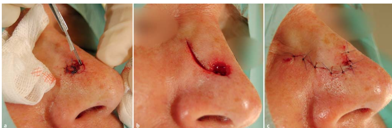
Abb. 2 (2. Operation) Links: gezielte Rand PE bei 4–5 Uhr im tumorpositiven Abschnitt mit dem Doppelskalpell. Mitte: Defekt nach Exzision des Tumors und nach Präparation des Rotationslappens. Rechts: Verschluss des Defektes mittels Rotationslappenplastik.

Routine-Histologie (Formalin-fixiert, Paraffineinbettung, HE-Färbung), zur lückenlosen mikroskopischen Randschnittkontrolle und zur mikroskopischen Untersuchung der tiefen PE verschickt. Schließlich wurden die Wunden mit fortlaufender Hautnaht, Strips und kleinem Verband verschlossen (► Abb. 1).