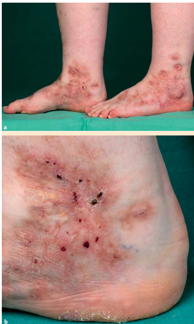
Abb. 1 a Rezidivierende Ulzerationen hinterlassen irreversible Hautveränderungen an der unteren Extremität einer 22-jährigen Patientin. Seit dem 11. Lebensjahr sind Krankheitsschübe aufgetreten. b Das Bild von parallel auftretenden Ulzerationen und Atrophie blanche wird durch postinflammatorische Hyperpigmentierungen abgerundet. Die Racemosa-Zeichnung ist im vorliegenden Bild gering ausgeprägt.

Hyperpigmentierungen. Angedeutete Livedo-racemosa-Zeichnung. Die Hautveränderungen überschreiten nicht die untere Hälfte des Unterschenkels (● Abb. 1 b ). Die Haut ist eher kühl als überwärmt. Die Patientin ist adipös (BMI 34). Keine Medikamenteneinnahme.