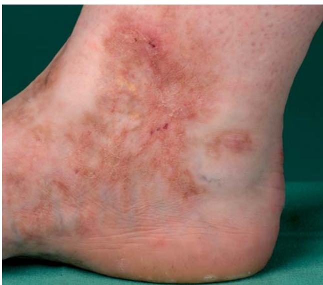
Abb. 3 Detailausschnitt der medialen Fersenregion der Patientin unter Enoxaparin-Therapie. Die zuvor krustös belegten Ulzerationen sind abgeheilt. Es sind keine weiteren Hautinfarkte mehr aufgetreten und die Ulzerationsneigung ist zum Stillstand gekommen.

gung wird der Einsatz der „Pille“ aus hämostaseologischer Sicht kritisch gesehen und Alternativen sind empfehlenswert.