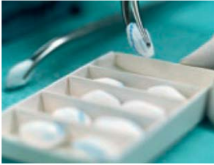
Abb. 5 Die Präpariertupfer (z. B. von der Fa. Hartmann) sind in einer Schiebeshachtel mit Rasterung. So lassen sich die kleinen Präpariertupfer besser handhaben, v. a. aber hat man die genaue Anzahl der Tupfer stets vor Augen. Die Tupfer sind röntgenarmiert.