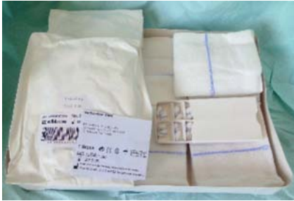
Abb. 3 Auch bei einem vorgefertigten Set gilt das Prinzip der Zählkontrolle, die ebenfalls über das Vier-Augen-Prinzip durchgeführt werden sollte.