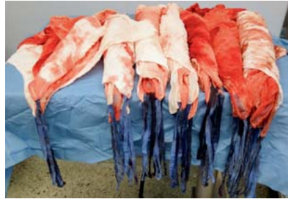
Abb. 4 Verwendete gezählte Bauchtücher, übersichtlich im 5er-Bündel gerollt. Zählung erfolgt durch das Vier-Augen-Prinzip.

wendete Bauchtücher und Kompressen als Putztücher zu benutzen. Hier besteht die zusätzliche Gefahr, dass solche als Reinigungstücher verwendete Bauchtücher in die abschließende Zählkontrolle geraten.