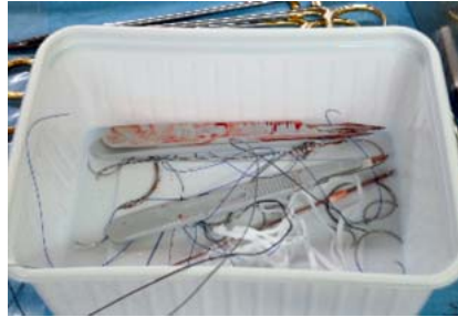
Abb. 2 Sicherheit am OP-Tisch. Für Nadeln und Spitzabfälle immer einen separaten Abwurfbehälter auf dem Tisch bereitstellen und einhalten. Ein sorgfältiges, einzelnes Durchzählen aller Verbandstoffe nach dem Entnehmen aus der Verpackung ist dringend anzuraten. Denn fehlerhaft bestückte Verpackungen sind nicht auszuschließen, hieraus können wiederum fatale Fehler resultieren.

Eine bundeseinheitliche Regelung zur Standardisierung und Dokumentation der Zählkontrolle im OP-Saal würde die Fehlerquote mit großer Wahrscheinlichkeit deutlich verringern und das Operationsteam rechtlich absichern.