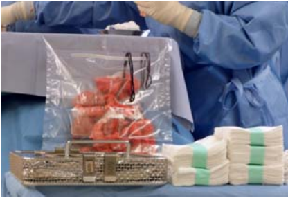
Abb. 1 Zählkontrollen tragen dazu bei, potenzielle Risiken für Patienten zu minimieren und insbesondere dafür Sorge zu tragen, dass die Patienten die OP-Abteilung nicht mit zurückgelassenen Materialien verlassen.