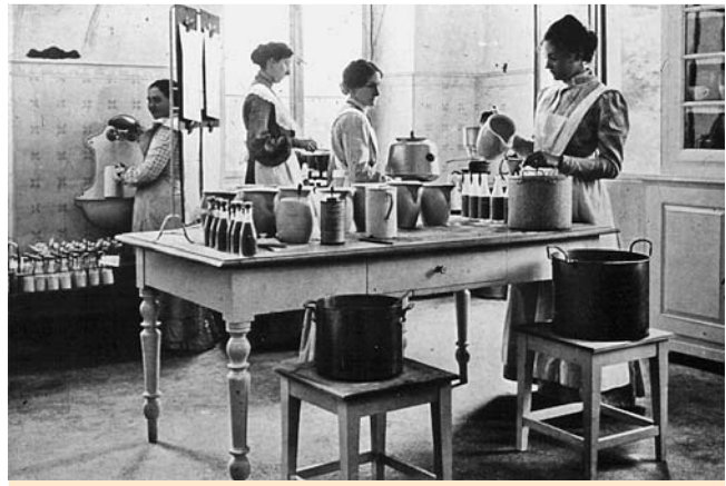
Abb. 4 Nahrungszubereitung in der Milchküche der Kinderklinik Heidelberg etwa um 1930.

weitere Verbesserungen etwa bei der Optimierung der Zufuhr an ungesättigten Fettsäuren oder mit dem Zusatz von Präbiotika angestrebt. Insgesamt ist aber die Adaptation an die Muttermilch weit fortgeschritten, und somit ist das nutritive Risiko einer künstliche Säuglingsernährung klein geworden. Morbiditäts- und Mortalitätsunterschiede bei Mutter- oder Flaschenmilchernahrung sind deshalb heute nur noch gering.