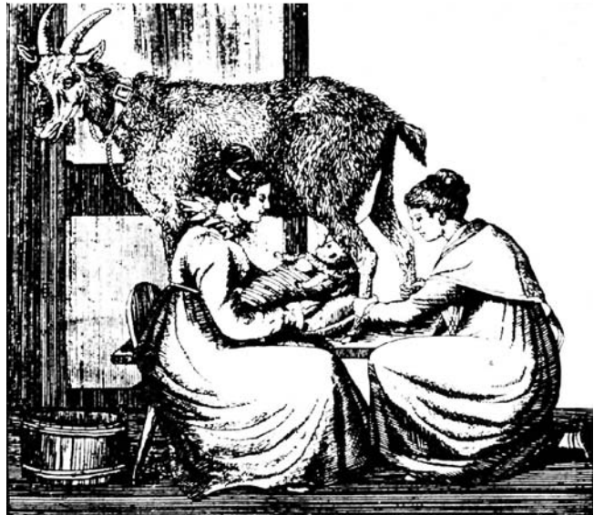
Abb. 2 Künstliche Ernährung mit Tiermilch (Bild: aus einer Klinik in Frankreich).

Die Analysen der Kuh- und Frauenmilch legten die Verdünnung der Kuhmilch zur Reduktion des Proteinanteiles sowie die Zugabe von Kohlenhydraten zur Kalorienanreicherung als wichtige Schritte zu einer verbesserten Verträglichkeit der Kuhmilchernährung nahe. Das Was und Wie möglicher Modifikationen war von da an für Jahrzehnte Gegenstand vieler Publikationen, und nicht alle Vorschläge führten zu einer verbesserten Ernährung des Säuglings. Dennoch zeigten sich mit der Zeit Erfolge der künstlichen Ernährung, wenngleich andere Veränderungen, die nicht die Zusammensetzung der Nahrung betrafen, dazu wesentlich beigetragen haben. Besonders bedeutsam dafür waren die neuen Erkenntnisse zur Hygiene und Bakteriologie. Durch die Arbeiten von Semmelweis, Koch, Pasteur, Gram, von Behring und anderen wurde in der zweiten Hälfte des 19. Jahrhunderts die bakteriologische Ätiologie für zahlreiche Erkrankungen bewiesen. Milch erwies sich als gutes Nährmedium für Bakterien und die bakterielle Kontamination der Säuglingsnahrungen verschlechterte die Verträglichkeit der Kuhmilchernährung erheblich [4].