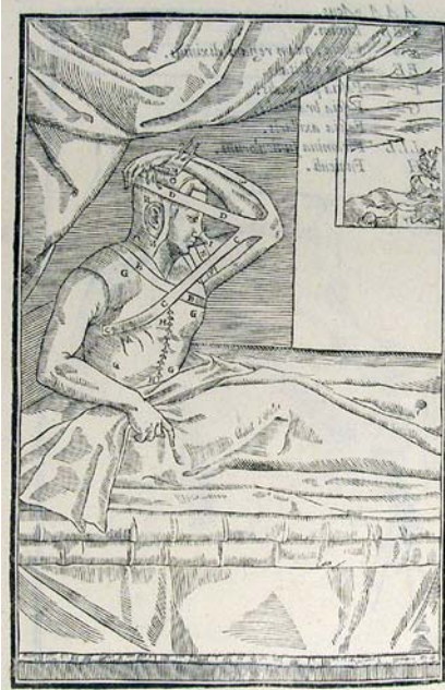
Abb. 3 Abbildung des Verbandes nach dem dritten Akt [4].

führende Mittel angezeigt und Aufregungen des Gemütes zu vermeiden. Neben der Ausbildung zusätzlicher Entstellungen war das Hauptrisiko die Gefahr von schwerem Wundbrand.