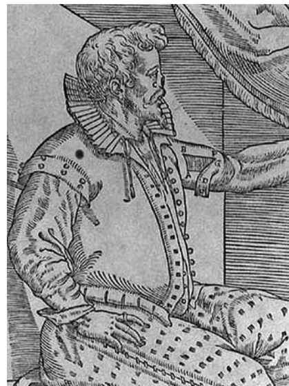
Abb. 2 Darstellung des zweiten Aktes [4].

sei kurz die italienische Methode vorgestellt, die dann durch von Graefe zur deutschen Methode modifiziert wurde. Nach Tagliacozzi [4] beinhaltet sie sechs Akte: