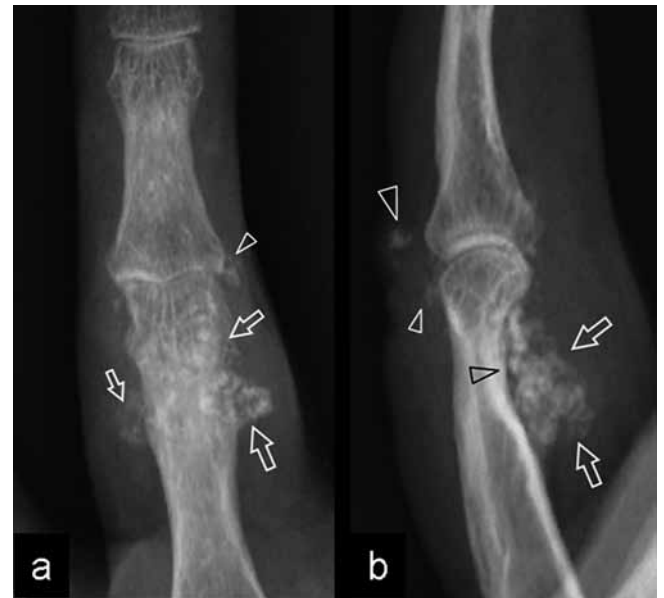
Fig. 1 a Anteroposterior and b lateral radiographs of the right ring finger. Soft-tissue calcified deposits (arrows) are visible on the volar aspect of the proximal phalanx associated with mild pressure erosion (black arrowhead) of the underlying bone. On the dorsal aspect of the joint, two small calcifications are also present.

Synovial chondromatosis is an unusual condition that most often involves synovial joints with or without extension into adjacent bursae. It is characterized by production of multiple cartilaginous nodules that derive from chondral metaplasia of the synovial membrane. This benign disorder clinically manifests with pain, swelling, intermittent joint locking and limitation of motion. Although any other synovial joint may theoretically be involved, synovial chondromatosis is rarely found in the fingers with only seven cases reported in the literature (Sheldon PJ et al. Radiographics 2005; 25: 105–219). In this case report, we describe the imaging findings of a patient with recurrent primary synovial osteochondromatosis of the proximal interphalangeal joint. To the best of our knowledge, this is the first case described in the literature, illustrated with ultrasound and a multimodality imaging study including plain films, ultrasound, CT, and MRI.