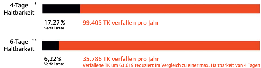
► Abb. 2 Verlängerung der Haltbarkeit von Blutspenden. * [83]; ** Annahme: Erhöhung der max. Haltbarkeit um 40 Stunden, 1,6% Reduktion der Verfallsrate pro zusätzliche Stunde max. Haltbarkeit [84].

spendetem Blut jährlich Beträge in Höhe eines zweistelligen Millionenbereichs. Dies bedeutet auch eine ideelle Aufwertung der altruistischen Blutspende.