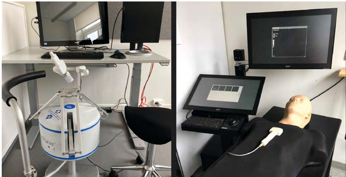
► Fig. 3 Simulation setup examples.