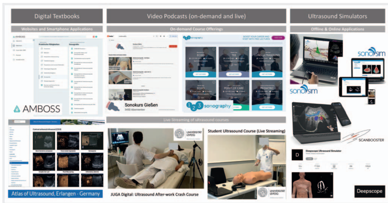
► Fig. 1 Exemplary overview of digital training formats in ultrasound.