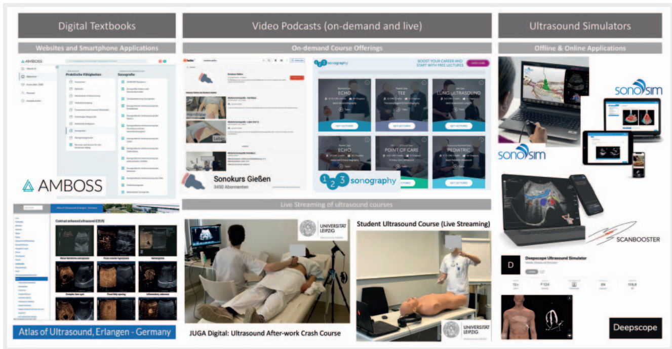
► Fig. 1 Exemplary overview of digital training formats in ultrasound.