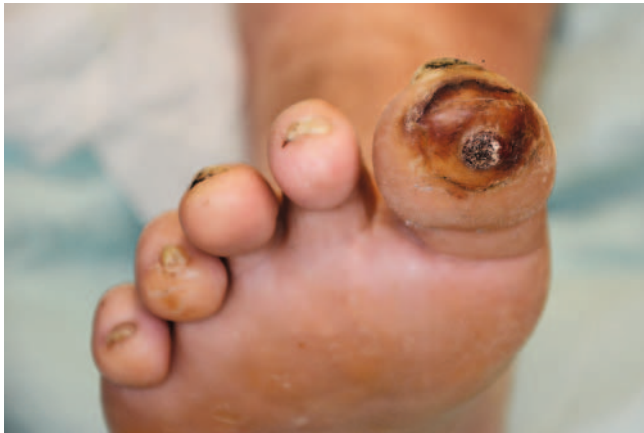
► Abb. 1 Patient mit insuffizient eingestelltem Diabetes mellitus Typ II und einem schmerzlosen diabetischen Fußulkus. Die Hyperkeratose zeigt deutlich die Fußfehlbelastung bei Polyneuropathie. Daher ist die Druckentlastung mittels adäquatem Schuhwerk die wichtigste konservative Therapiemaßnahme. In der Wundtherapie steht das Debridement aktuell im Vordergrund.

renden Wunden (► Abb. 1 ), mal in Remission, dann wieder mit spontaner Eröffnung durch unbemerkte lokale Drucküberbelastung (z. B. durch Schuhwerk), basierend auf der diabetischen Neuropathie, häufig in Kombination mit einer Makroangiopathie.