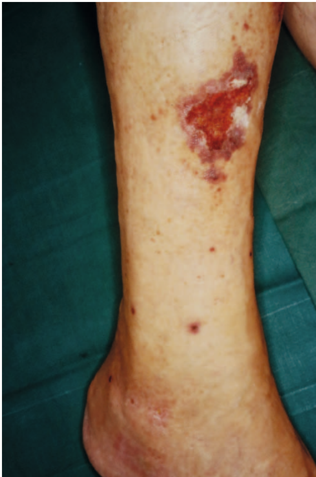
► Abb. 3 Patient mit einem sehr schmerzhaften Ulcus cruris aufgrund einer kutanen leukozytoklastischen Vaskulitis. Es erfolgte die Einleitung einer systemischen Therapie mit Glukokortikoiden. Nach Durchführung einer lokalen antiseptischen Therapie mit PHMB über jeweils 20 Minuten erfolgte die Wundtherapie mittels beschichteter Gazen und aufgrund der Schmerzen mit einem Zweikomponenten-Kompressionssystem in der „Lite“-Ausführung mit 20 mmHg.

(► Tab. 1 ), wobei nur Level I und II für Evidenz im eigentlichen Sinne stehen. Die im Expertenkonsens empfohlenen lokalen Therapiekonzepte haben im internationalen Kontext allerdings große Übereinstimmungen [3, 4], was sie zu guten, wenn auch nicht Evidenz-basierten Informationsquellen macht.