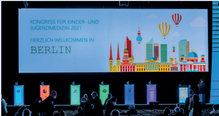
► Abb. 1 Eröffnungsveranstaltung des DGKJ-Kongresses; Quelle: ©DGKJ/Hauss.

In diesem Jahr fand die Jahrestagung der GKJR zusammen mit der Tagung der DGKJ erstmalig im Format eines Hybridkongresses auf dem Berliner Messegelände statt. In insgesamt 12 von der GKJR ausgerichteten Sitzungen wurden unterschiedliche Aspekte der Pathogenese chronischer Entzündungsprozesse, der Diagnostik der Erkrankungen sowie aktuelle und zu erwartende therapeutische Optionen vorgestellt und diskutiert. Da in zahlreichen weiteren Sitzungen kinderrheumatologische Themen mit Kollegen anderer Fachdisziplinen diskutiert wurden, konnte die Sicht auf die Genese sowie das diagnostische und therapeutische Management der komplexen Krankheitsbilder aus unterschiedlichsten Blickwinkeln beleuchtet werden.