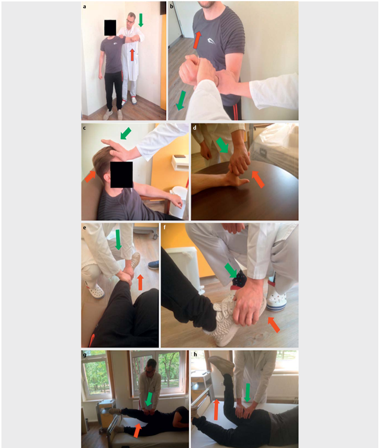
► Abb. 2 Bei Verdacht auf Myositis wird die Durchführung des Manual Muscle Testing-8 (MMT-8) empfohlen (0 bis 80). a. Muskelkrafttest der Schulterabduktoren (0–10), b. Muskelkrafttest des M. biceps brachii (0–10), c. Muskelkrafttest der Nackenbeuger (0–10), d. Muskelkrafttest der Extensoren des Handgelenks (0–10), e. Muskelkrafttest des M. quadriceps (0–10), f. Muskelkrafttest der Dorsalflexoren des Sprunggelenks (0–10), g. Muskelkrafttest des M. gluteus medius (0–10), h. Muskelkrafttest des M. gluteus maximus (0–10)