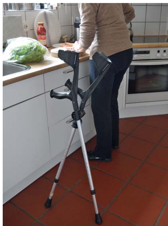
► Abb. 2 Im Einsatz in der Küche.