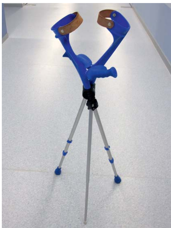
► Abb. 1 Dreibein wie ein Stativ.

Das Gelenk hat sich bei den Autoren, ihren Bekannten und Verwandten bewährt! Hier keine Werbung mit Firmennamen, aber Bezugsquellen bei den Autoren.