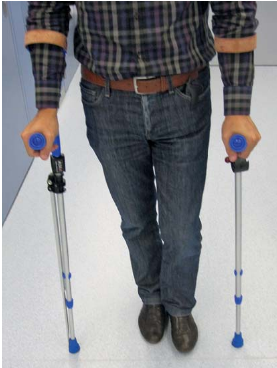
► Abb. 4 Gelenk mit angeklappter Stütze, rechte Patientenseite.