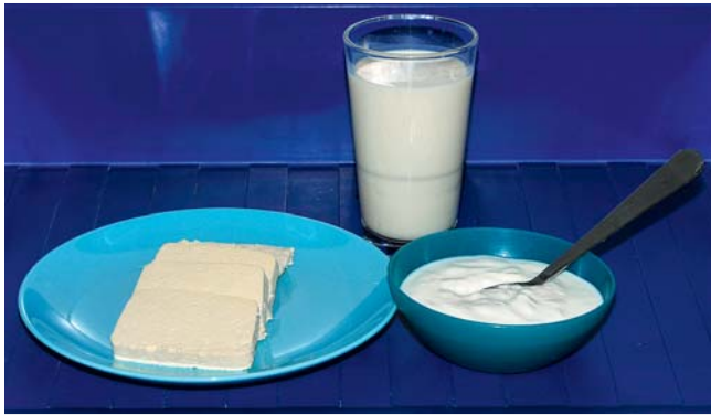
► Abb. 1 Sojamilch, Sojajoghurt und Sojatoфу als Lifestyleprodukte.

ten möglich sind, und das Birkenpollenhomolog Gly m 4. Das Eiweiß Gly m 4 zeigt dabei eine Strukturhomologie zu dem Birkenpollen-Majorallergen Bet v 1, einem Protein der PR-10-Familie. IgE-vermittelte Reaktionen gegen dieses Protein sind vorwiegend im Jugend- und Erwachsenenalter für leichte Reaktionen eines oralen Allergiesyndroms (OAS) verantwortlich, können jedoch bei Verzehr größerer Mengen geringgradig verarbeiteter Sojaprodukte (z. B. Sojadrink) bei Birkenpollenallergikern ebenfalls zu schweren allergischen Reaktionen mit Atemwegsverlegung und Anaphylaxie führen (► Abb. 2 ). Immunzellen, die gegen Bet v 1 gerichtet sind, können dementsprechend auch an das Sojaprotein Gly m 4 binden und allergische Reaktionen auslösen. Wir möchten aus diesem Grund 4 Fallberichte von Birkenpollenallergikern aus unserer Allergieambulanz vorstellen, die durch Sojadrink schwere Soforttypreaktionen entwickelt haben.