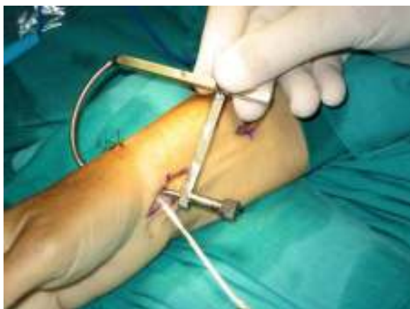
Figura 1 Guía utilizada en la realización de los túneles transóseos en escafoides y semilunar. Incisiones palmares en muñeca con plastia de palmar mayor.

Krimmer et al. 11 y el cuestionario Quick-DASH 12 fueron evaluados al final del seguimiento.