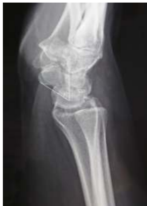
Figura 6 Radiografía lateral al final del seguimiento que muestra un ángulo EL de 55°.

Los injertos hueso-tendón-hueso 4 son una alternativa a la capsulodesis cuando no hay mal alineamiento del escafoides, ya que la reconstrucción aislada de la porción dorsal del ligamento EL no soluciona el problema de la malrotación multiplanar del carpo 3 . Utilizando un autoinjerto hueso-tendón-hueso de la segunda articulación carpometacarpina —como describe Cuénod 18 — Kalb 19 interviene 16 pacientes de los cuales 12 tienen inestabilidad estática; después de