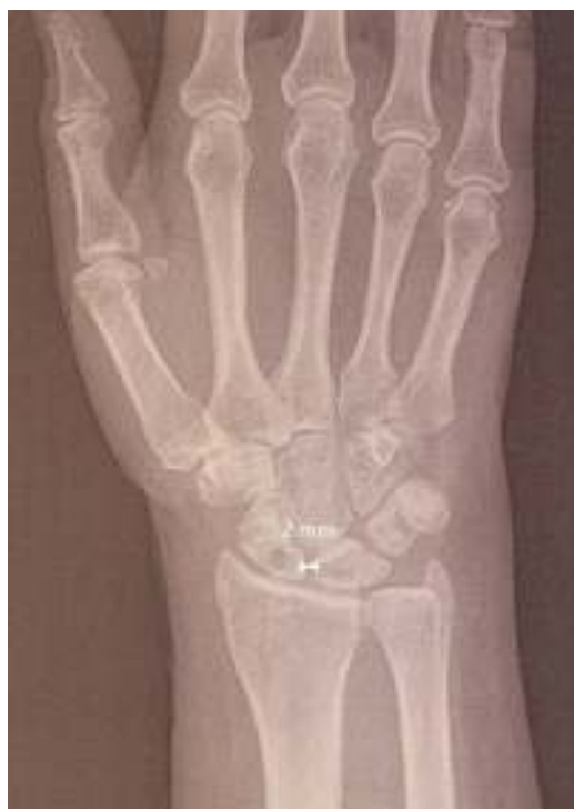
Figura 5 Radiografía postoperatoria al final del seguimiento; en la radiografía anteroposterior se aprecia una separación EL de 2 mm.

(°): grados; Dcho.: derecho; Izqdo.: izquierdo; mm: milímetros; Postop.: postoperatorio; Preop.: preoperatorio.