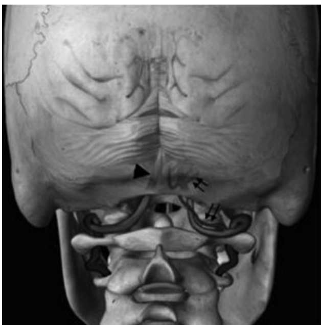
Fig. 2 Imagem que ilustra a relação anatômica entre as vértebras cervicais altas e as artérias vertebrais, as quais penetram na dura-máter entre o arco posterior de C1 e o forame magno. A zona de segurança usualmente se estende até 8 mm de cada lado da linha média. A artéria cerebelar inferoposterior usualmente se origina no segmento V4 intracraniano (ponta da seta); no caso apresentado, ela se origina sobre o arco de C1 (setas duplas).

fundamental importância em todos os procedimentos invasivos da transição craniocervical, que variam desde uma punção líquórica no nível de C1-C2 até acessos cirúrgicos