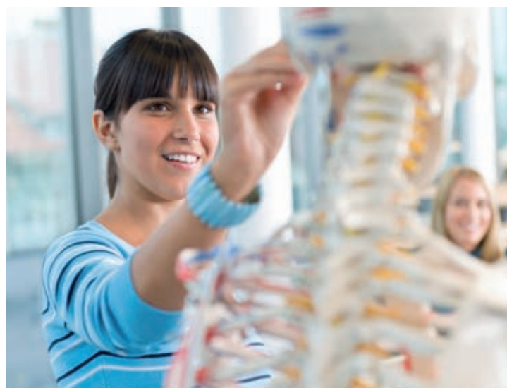
Grafik: BITmap, Mannheim